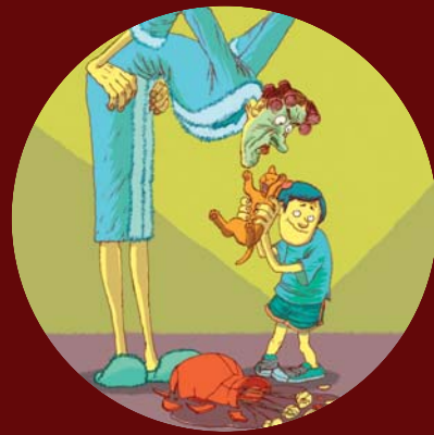
A felnőttek bántalmazása testi sértés. Az állatok bántalmazása állatkinzás. A gyermekek bántalmazása „az ő javukra szolgál“.

Az ENSZ Gyermekjogi Bizottsága a következőképpen definiálja a testi fenyítést: „testi erő alkalmazásával történő bármilyen büntetés, melynek célja, hogy akár csak a legcsekélyebb mértékben is fájdalmat vagy kényelmetlenséget okozzon. Leggyakoribb formája a gyermekek megütése (füles, náspángolás, nyakleves) kézzel vagy valamilyen eszközzel – ostorral, bottal, övvel, cipővel, fakanállal, stb. De lehet ez például a gyermek meg-rúgása, megrázása, eldobása, karmolás, csípés, harapás, hajhúzás, pofozás, kényelmetlen testhelyzetekbe kényszerítés, égetés, forrázás vagy különböző dolgok szájba eröltetése (például a gyermek szájának kimosása szappannal, vagy kényszerítés csipős fűszerek lenyelésére)“.