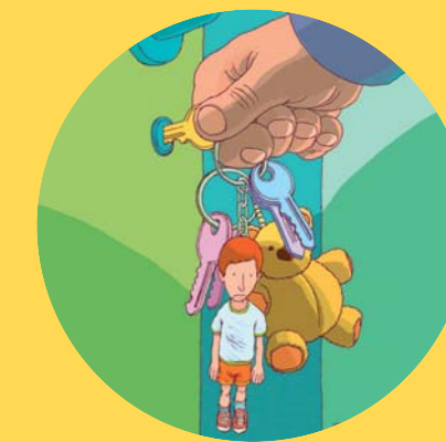
A gyermek nem a szülő tulajdona

A pozitív szülői magatartás a gyermekek érdekeinek maximális figyelembevételén alapul. Lényege a gondoskodás, önállóságra nevelés, elismerés és útmutatás, de ide tartozik bizonyos korlátok felállítása is - a gyermek teljes körű fejlődése érdekében. A pozitív szülői magatartás előfeltétele a gyermek jogainak tiszteletben tartása és az erőszakmentes környezet, ahol a szülők nem alkalmaznak testi vagy lelki megalázó fenyítést sem a konfliktusok kezelésére, sem pedig abból a célból, hogy a gyermekeket fegyelemre vagy tiszteletre tanítsák.